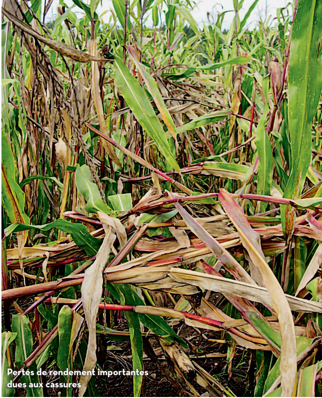
Pertes de rendement importantes dues aux cassures