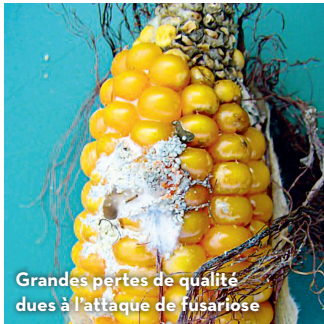
Grandes pertes de qualité dues à l'attaque de fusariose