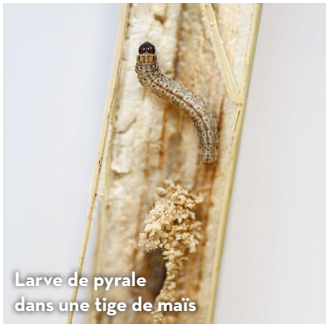
Larve de pyrale dans une tige de maïs

Vol et ponte de la pyrale du maïs de la mi-juin à la mi-août environ. Les œufs donnent naissance aux larves, lesquelles dévorent l'intérieur des tiges de maïs. Cela provoque la rupture des tiges. Les attaques de la pyrale sont des portes d'entrée pour la fusariose, ce qui augmente la teneur en mycotoxines de la plante et des épis.