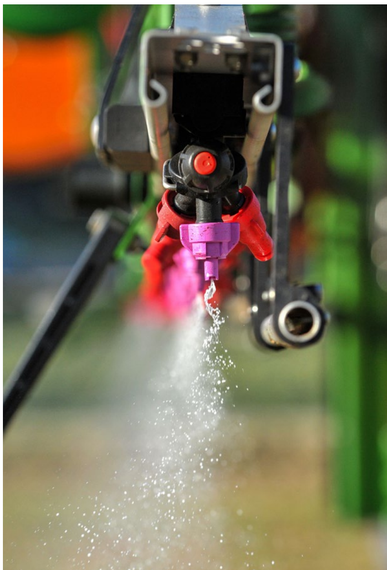
Lors de l'application d'herbicides, il faut absolument respecter la procédure indiquée par le fabricant.

sur le taux de décroissance annuel de germination des graines présentes dans le sol.