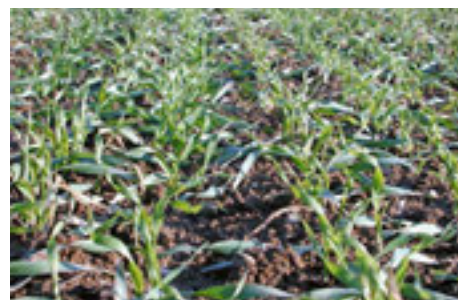
Wintergerste Beginn Bestockung