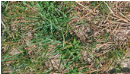
Untersaat nach der Ernte