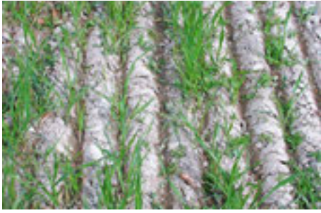
Walzen zum Brechen der Kruste