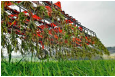
Grosse Unkräuter ausstriegeln