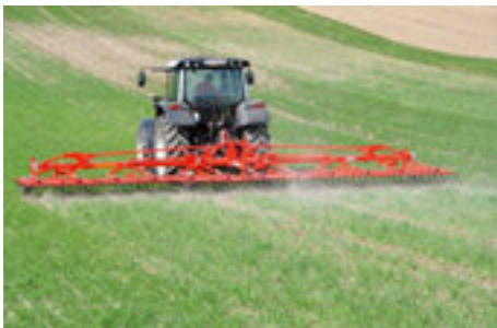
Striegeleinsatz gegen kleine Unkräuter

Das Ziel des Aktionsplan Pflanzenschutz und der Integrierten Produktion ist es, den Einsatz von Herbiziden auf ein Minimum zu reduzieren. Um das Ziel zu erreichen braucht es bessere Kenntnisse der Anbau- und Maschinenteknik. Die Unkrautbekämpfung muss über die ganze Fruchtfolge betrachtet werden. Es braucht den Wechsel zwischen Sommer- und Winterkulturen. In den nachfolgenden Empfehlungen finden Sie Informationen zur Mechanischen Unkrautbekämpfung mit und ohne anschließender Untersaat und zum Einsatz von Herbiziden.